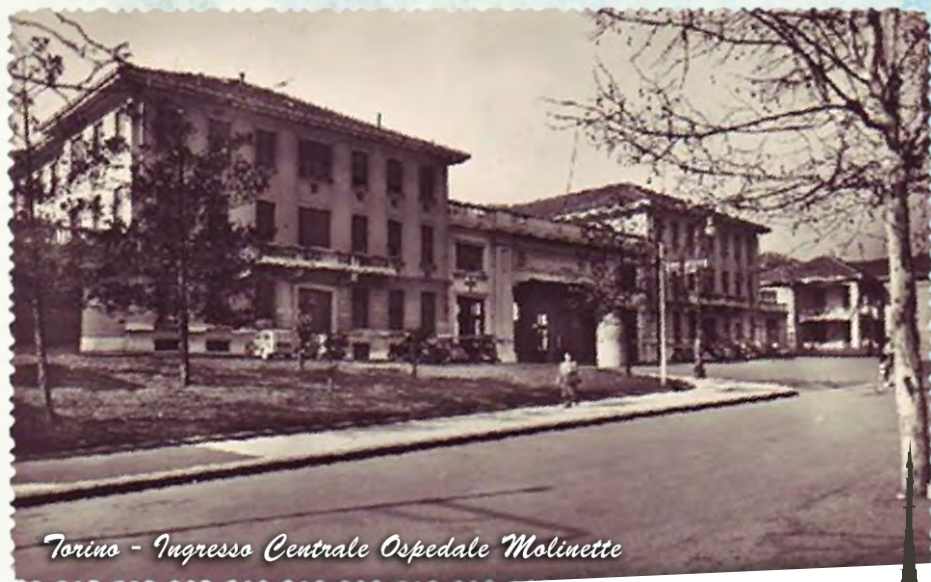
Torino - Ingresso Centrale Ospedale Molinette